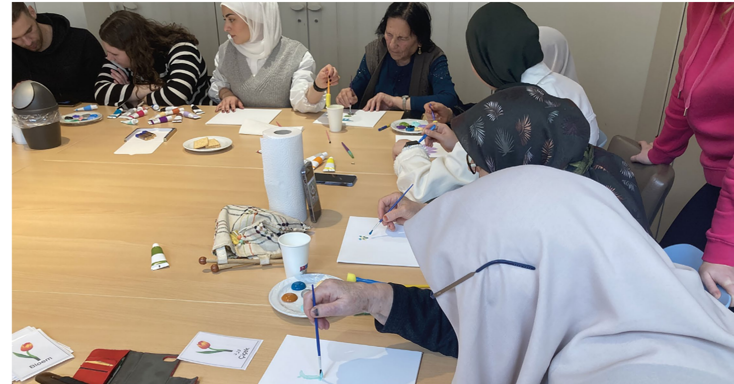
Samen activiteiten ondernemen om een relatie op te bouwen.