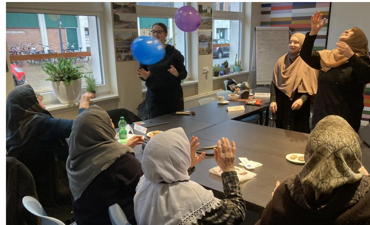
Samen optrekken om een relatie op te bouwen.

Deze publicatie vormt de basis voor een vervolgproject, waarin een toolkit wordt ontwikkeld die ingezet kan worden om in co-creatie samen te werken met deze doelgroep en onderzoek- en innovatietrajecten beter vorm te kunnen geven.