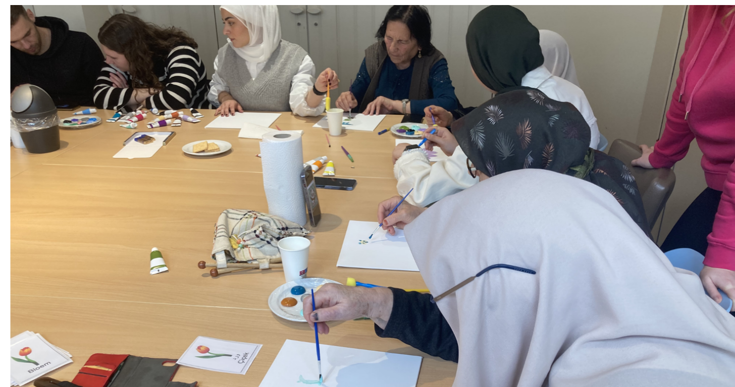
Samen activiteiten ondernemen om een relatie op te bouwen.