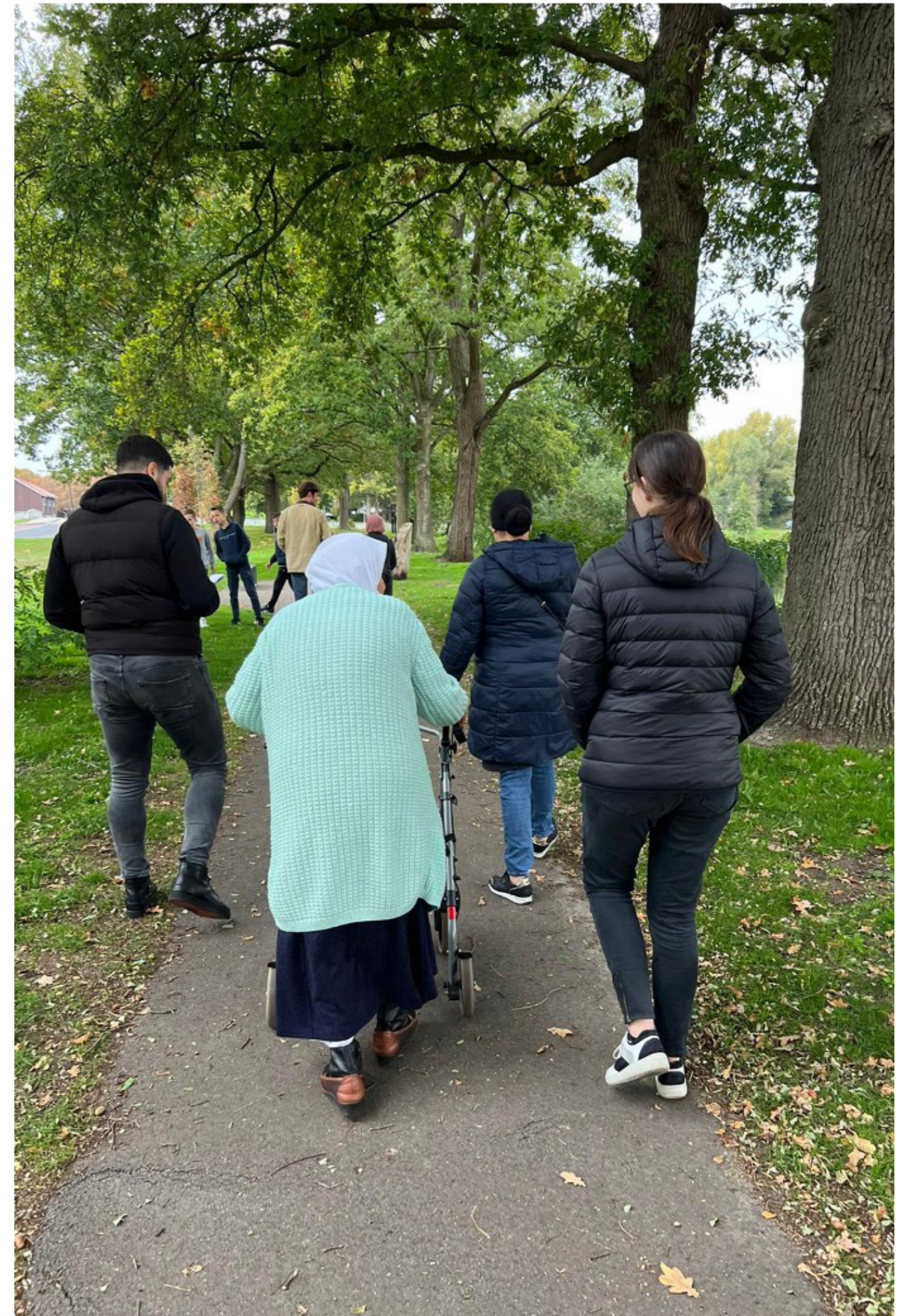
Samen bewegen om een relatie op te bouwen.